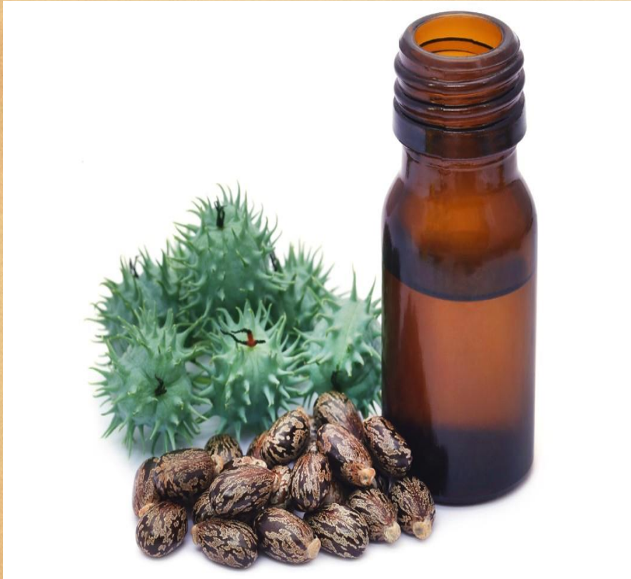
Óleo de rícino preto Jamaicano puro