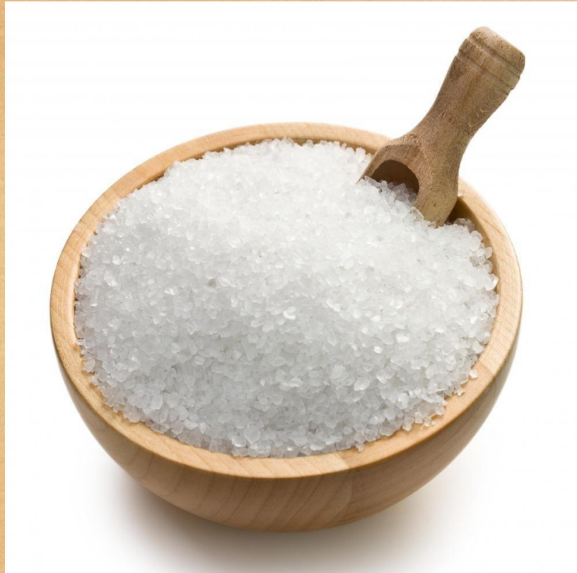
Sal de Epsom