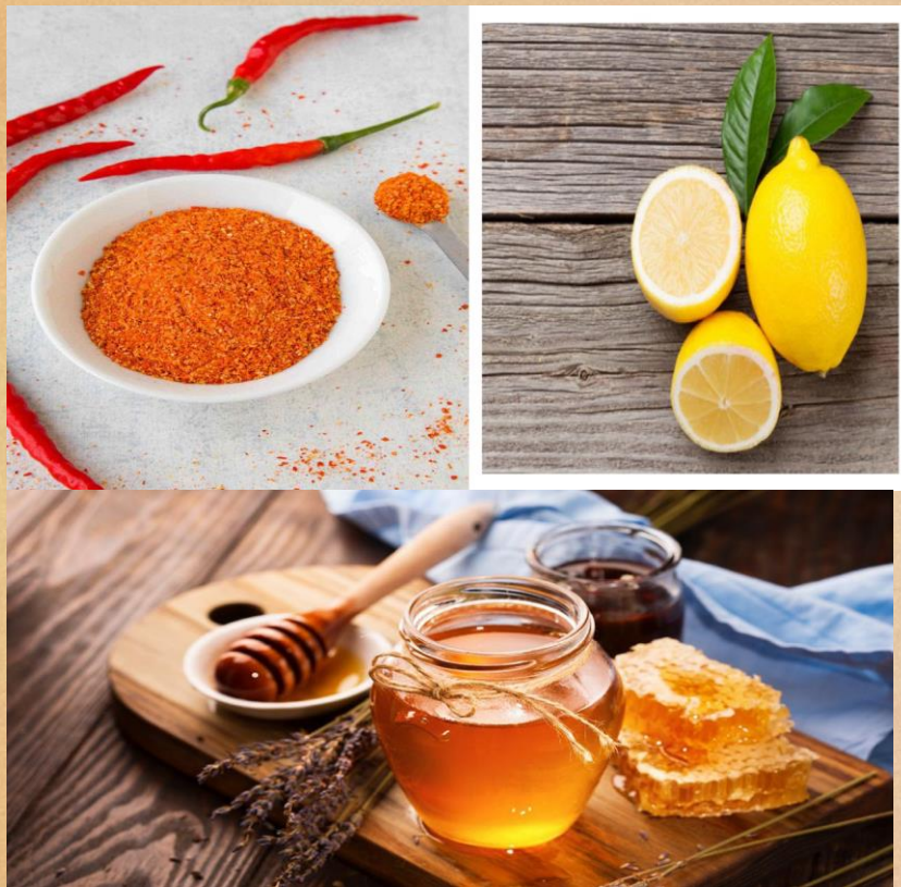
Pimenta Caiena, Mel e Limão