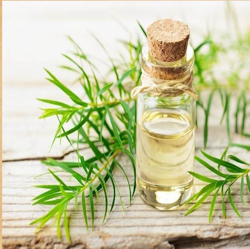
Óleo de Tea Tree