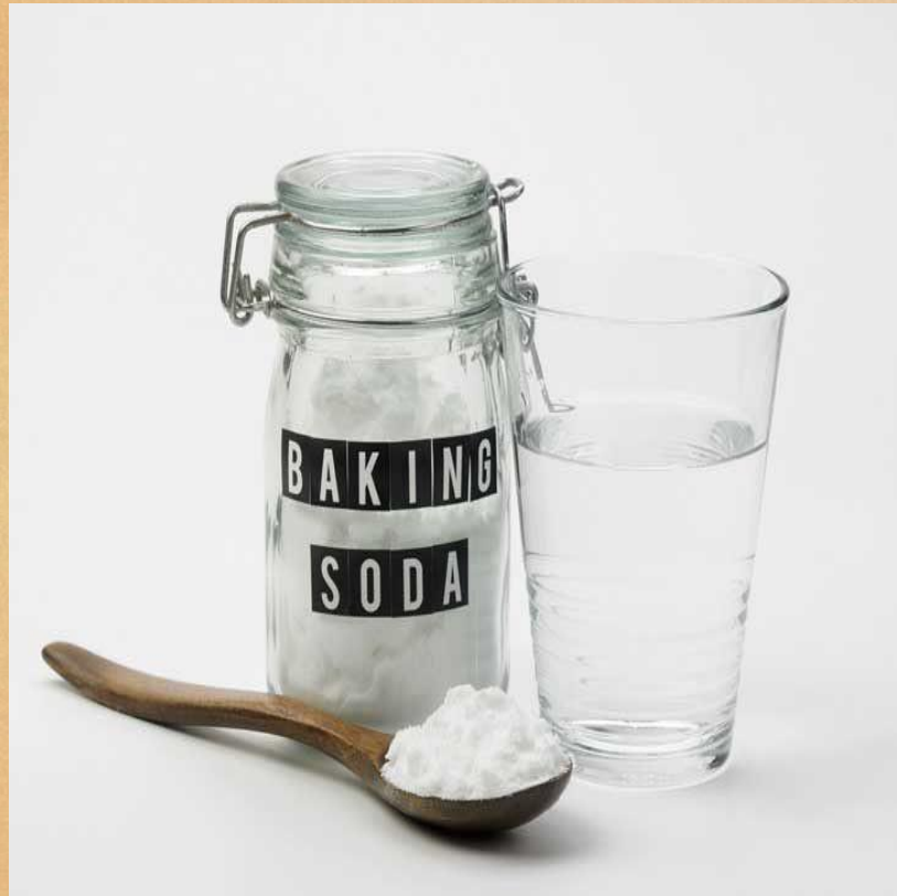
Bicarbonato de sódio