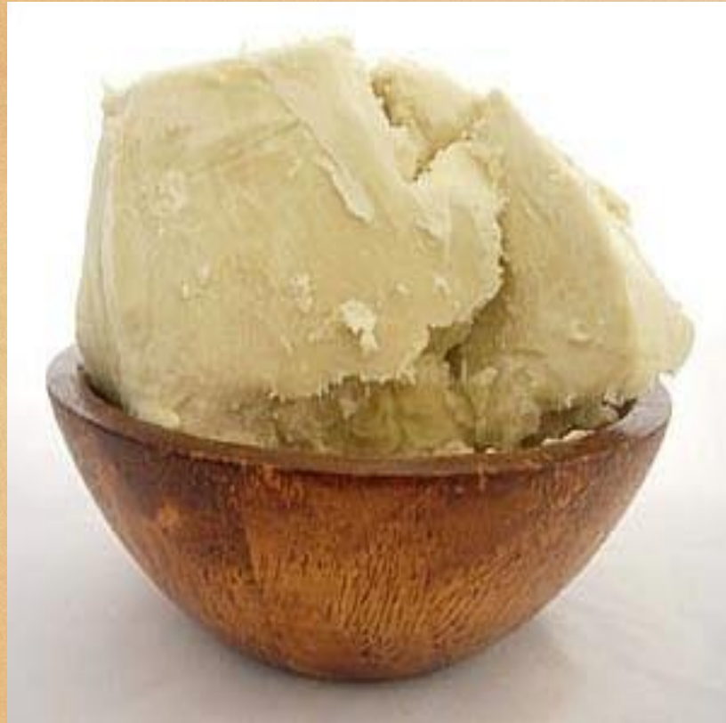
Manteiga de Karité Crua