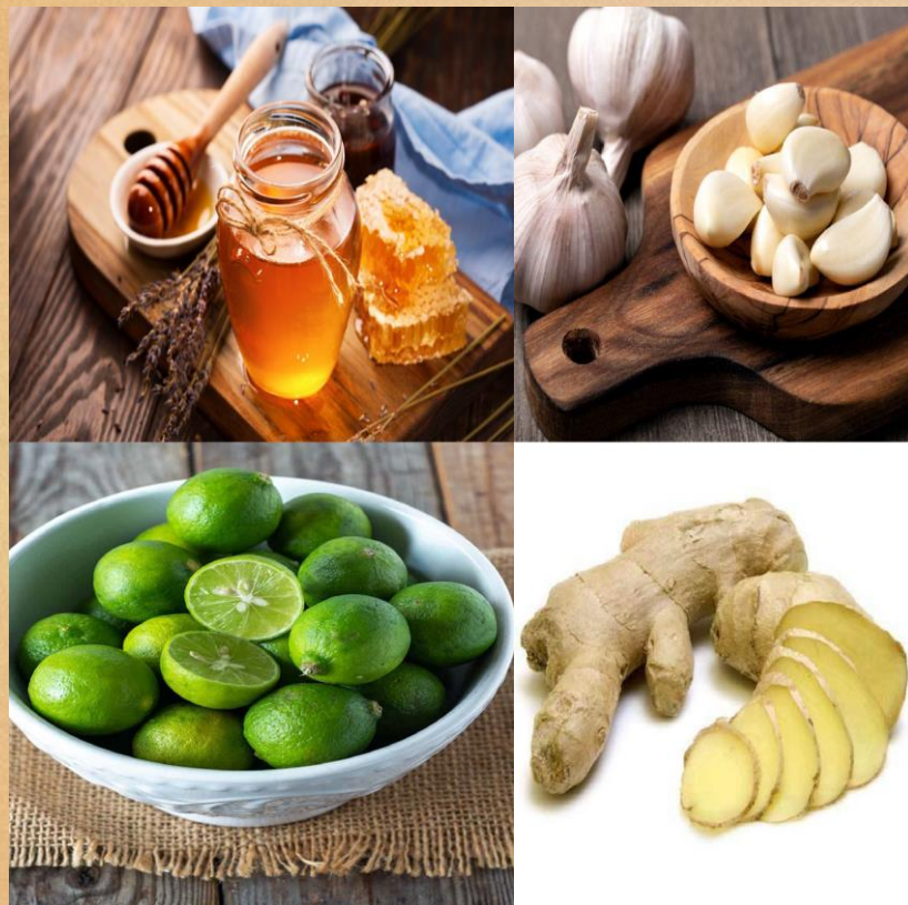
Mel, Limão, Gengibre e Alho