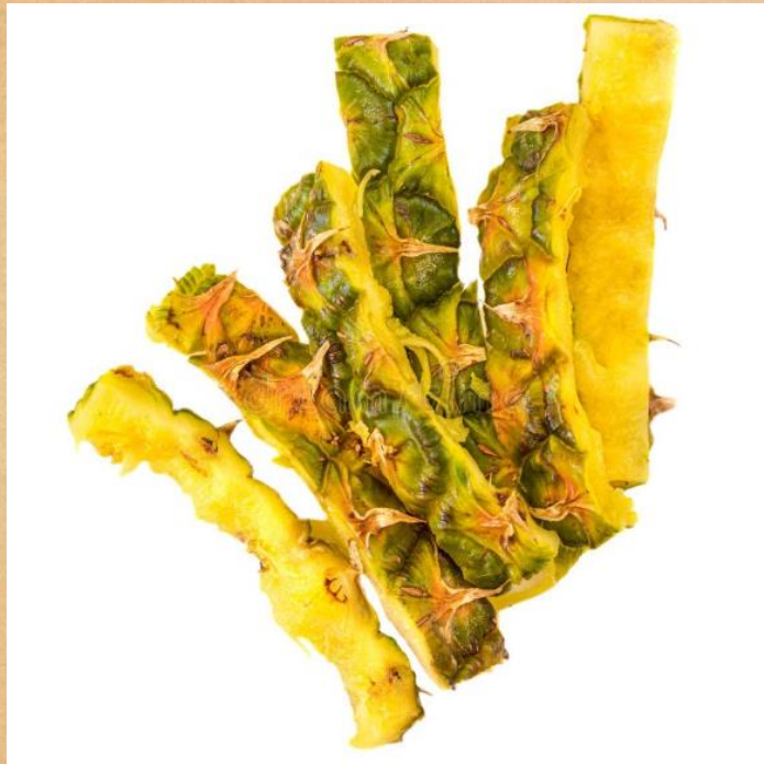
Casca de abacaxi